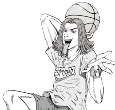
90年代ワカモノ“キュータ”