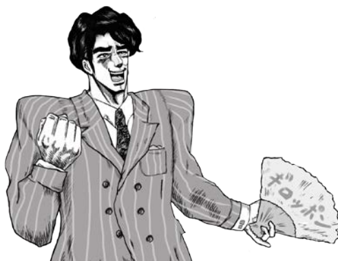
80年代ワカモノ“ハチオ”

現代のワカモノを分析することを使命に様々な時代のワカモノが時空を超えて集結。80年代ワカモノ“ハチオ”、90年代ワカモノ“キュータ”、2000年代ワカモノ“レイ”がホストキャラクターとなり「VR わかものラボ®」の研究内容を解説。『ワカモノ』を理解するための切り口として、オープンマインドタイプ、協調タイプ、マイウェイタイプの3つにセグメントしワカモノの特徴を紹介します。