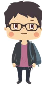
マイウェイタイプ