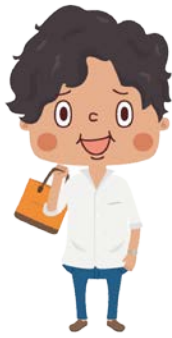
オープンマインドタイプ