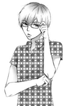
2000年代ワカモノ“レイ”